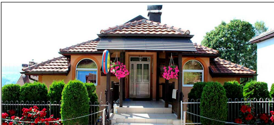
Смештај: Вила Ангелина

Увац, дубоко су усекле своје корито у кречњачке стене и формирале сужене клисурасто – кањонске долине са високим, стрмим кречњачким литицама. Меандри Увца су већ препознатљива слика из југозападне, али и целе Србије – сигурни смо да ће их, у годинама које следе, посетити бројни посетиоци из целог света. Резерват је стедиште око 130 врста птица, а најзначајније спада белоглави суп, једна од две преостале врсте лешинара које се данас гнезде на подручју Србије.